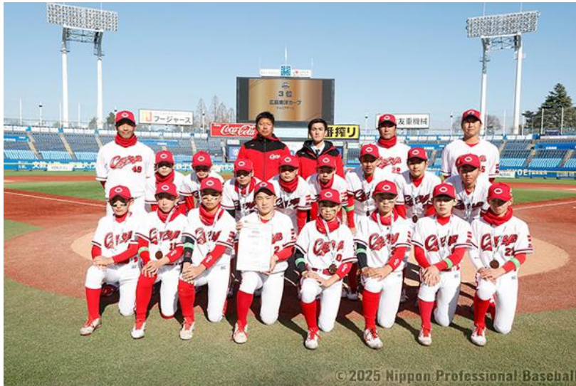
(2025 年度広島東洋カープジュニア)