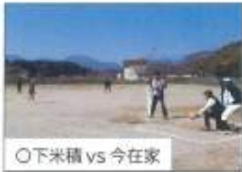
○下米積 vs 今在家