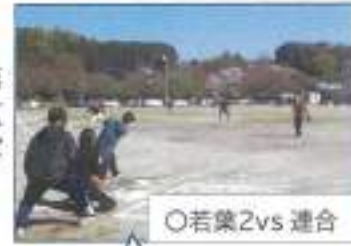
○若葉2 vs 連合

試合は若葉2が勝利しましたが、当日欠席者が出て急遽8人での試合となった為、連合チームが第二試合に進出しました。