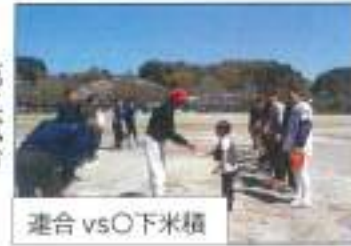
連合 vs ○下米積

試合は岡が勝利しましたが、疲労の為服部が決勝戦に進出しました。左記の通り市民体育大会には岡が代表として出場します。