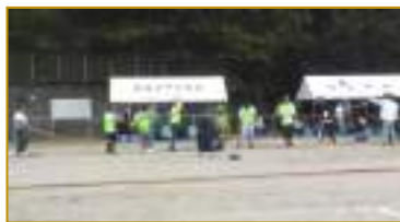
綱引き 1位 勝負谷・妻ノ神 連合

運動会を盛り上げてくださった選手や応援の皆様、当日の運営をいただいた体育部や自治公民館長会、スポーツ推進委員、中学生ボランティアといった役員の皆様、皆様のご協力のおかげで無事に開催することができました。ありがとうございました