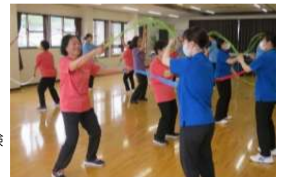
学生は3B体操も体験