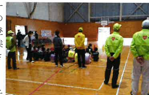
【4月14日 交通安全教室から】

地域の参加者からは、地域に愛着を持つ子どもを育てることやスポーツの奨励、地域の歴史を大切にすること、家族を大切にすることへの期待などについて、意見が出されました。また、朝の子どもたちの登校の見守りをしている人が多かったことから、朝の子どもたちの挨拶の様子についての意見も出ました。「もうすこし、挨拶の音が大きくなるか」とか、「挨拶をしようとする子どもたちが増えないか」とか、子どもたちの朝の姿勢が気になるとの感想が多く出されました。アイラブ西郷の活動をしておられる方から、4月以降3名の方から、子どもたちの挨拶の様子についての意見をいただきました。良い機会でもありますので、私たちからもしっかりと挨拶の声かけをして、子どもたちの声が響くような地域になるよう働きかけをしていきたいと思いました。