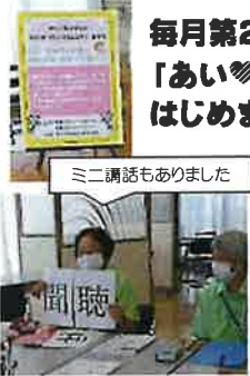
ミニ講話もありました

地域の人たちが集まって“ほっこり”する時間を過ごしてもらおう場所をつくりました。来る時間・帰る時間も、何をして過ごすかも自由です。 8月以降も開催しますのでお立ち寄りください。