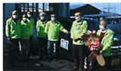
カーシェアリング使用率西とボランティアドライバー

共助交通(コミュニティ・カーシェアリング)を5月10日より小鴨地区全域で本運行します。利用を希望される方は、ご連絡ください。申し込みに関わる説明をさせていただきます。