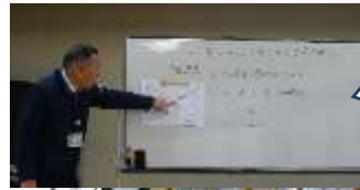
保護者のみなさんは子どもたちとは別室で活動。