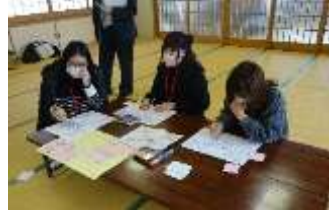
4月に小学校で会いましょう