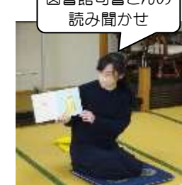
図書館司書さんの読み聞かせ