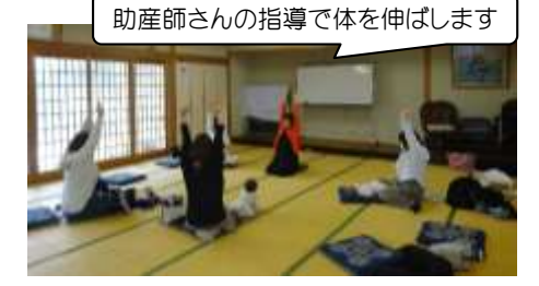
助産師さんの指導で体を伸ばします