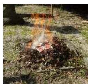
3月16日には、小鴨神社で合格祈願、絵馬のお焚き上げをしました。