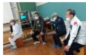
コマ回し・めんこ名人

倉吉養護学校中学部の生徒と、地域の大人が交流しました。地域の大人が「先生・名人」となって、コマ回し、めんこ、書初め、お手玉をしました。