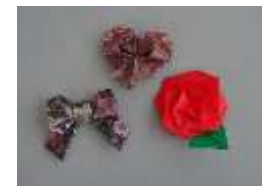
かわいい折り紙でカーテンを彩りました。