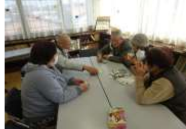
百人一首かるたで坊主めくりをしました。