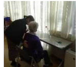
花一輪の健康法です。心が落ち着くひとときとなっています。