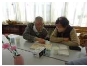
鳥取県パズルに挑戦。