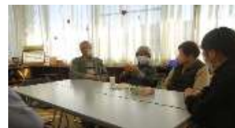
その後、歓談して過ごしました。