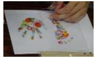
▲フラワーモチーフと ▼動物モチーフ。