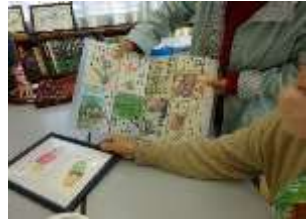
絵手紙鑑賞。力作です。