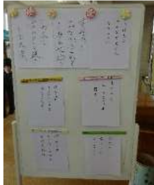
共作俳句です。参加者全員で堪能しました。