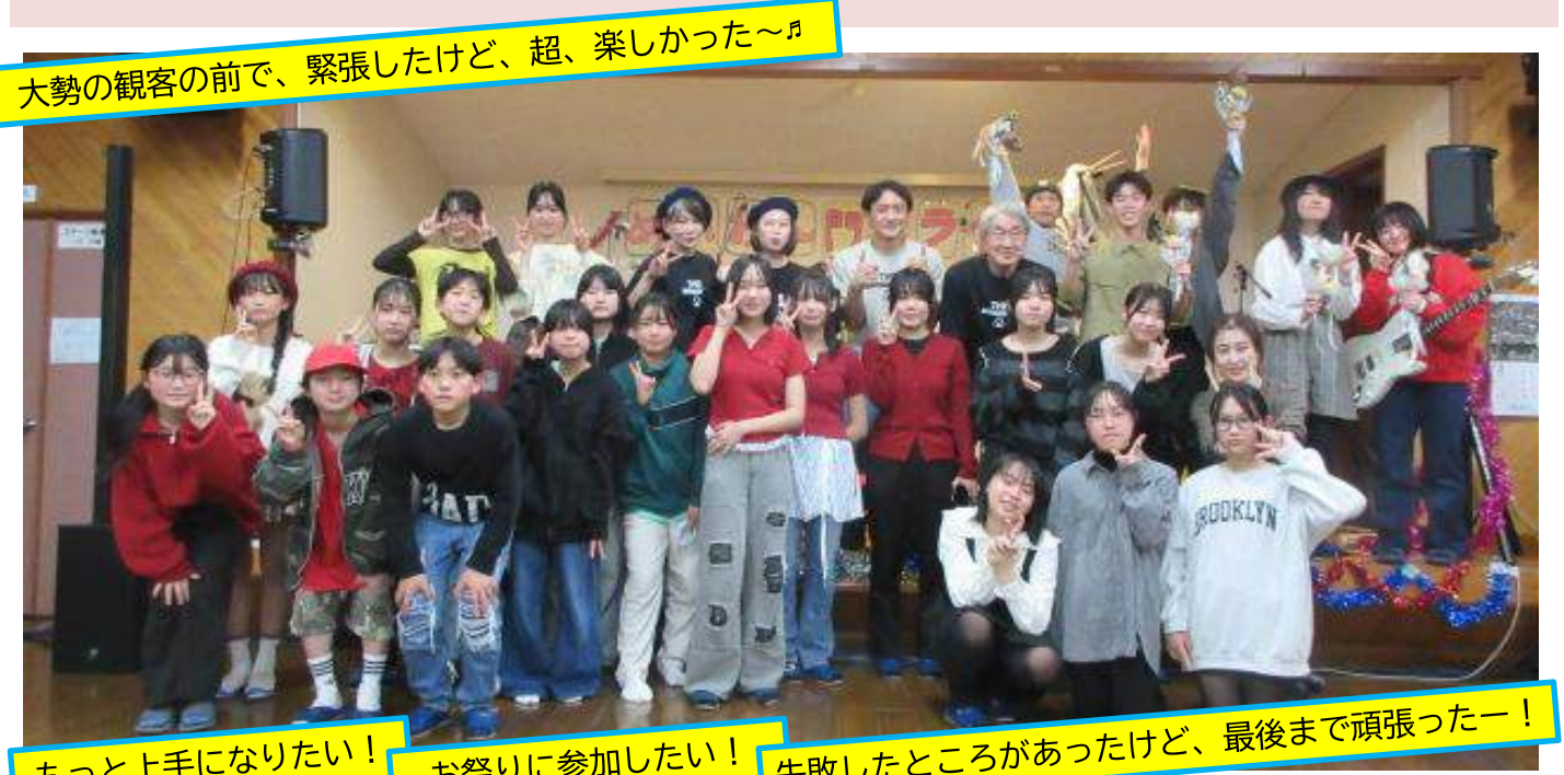
大勢の観客の前で、緊張したけど、超、楽しかった~♪