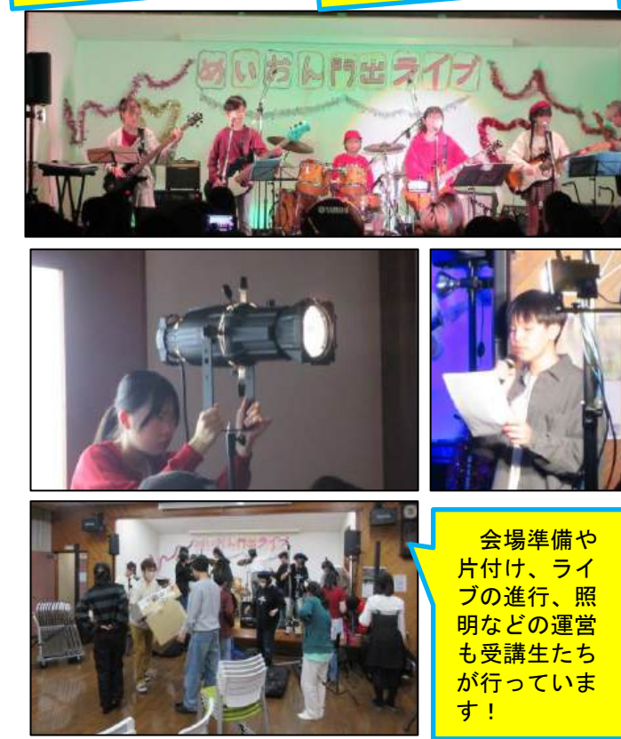
会場準備や片付け、ライブの進行、照明などの運営も受講生たちが行っています!

~みんなの門出にエールを贈り合う~ 3月29日(日)に受講生8バンド(子どもバンド7、大人バンド1)、講師チーム1バンドが出演し、進学、進級、転居など春の門出にエールを贈る「第14回めいおん門出ライブ」は全出演者42名、来場者数120人を数え、盛大に開催されました。 今年1月に開講し3か月、初めて楽器を手にした受講生から、すでに各地域のお祭りなどで演奏を披露してきた経験豊富なバンドまで、出演者はコミュニティセンターや自宅での練習を重ねてきました。 初めてライブに来た40代の方は「とても楽しかったです。たくさん練習したのが伝わりました」小学6年生は「友達が出ていて見に来ました。自然と笑顔になるライブでした。次は私もやってみたいです」など、感動や激励、応援、感謝の言葉が多く寄せられました。 16年目を迎えためいおんバンド講座は住民のボランティア講師の方々の支援で続いています。子どもたちは、この講座やライブを通じて様々な経験を重ね、成長しています。メンバーは今後もいろいろな祭りやイベントに出かけ、地域活動に参加していきます!