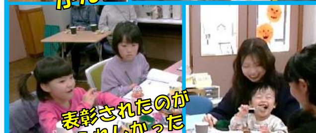
表彰されたのがうれしかった