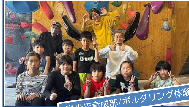
青少年育成部/ボルダリング体験

11/29 壁におかれたホールド(カラフルな石)を移動するには・体力、筋力、知力を総動員して！