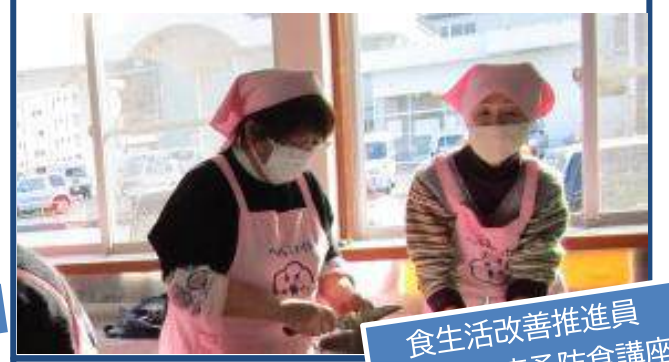
食生活改善推進員 生活習慣病予防食講座

12/10 生活習慣病、みなさんは大丈夫？ 食事を見直して予防への意識が高まりました！