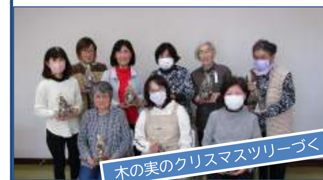
木の実のクリスマスツリーづくり

11/22 ・木の実を一つ一つボンドで付けていき、オシャレな卓上ツリーが出来上がりました☆