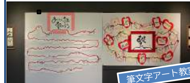
筆文字アート教室

11/7～20・“繋がる”をテーマに、未来中心アトリウムギャラリーで作品展示しました。一般来場者もたくさんのあったかいメッセージを書いてくださいました♡現在コミュニティセンターで展示中です