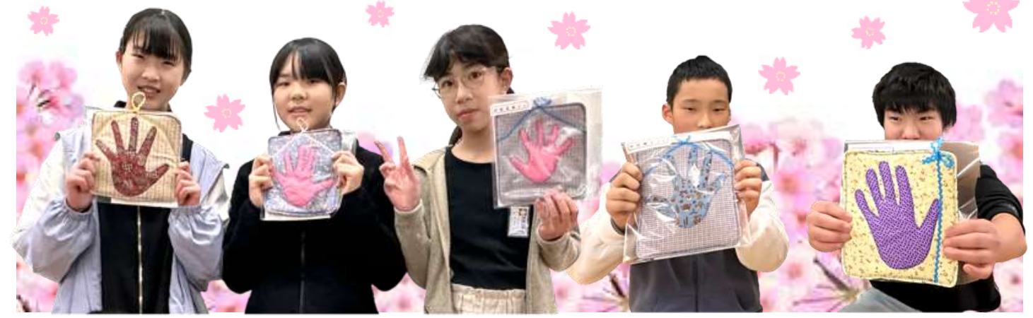
各事業の参加募集は中面をご覧ください♪

明倫小学校に入学した時にとった手形が6年の時を経て、素敵なパッチワークになり子どもたちの元へと帰ってきました🌸 12年前に始まった手形パッチワーク贈呈事業も今回で最後を迎えました🎉 もうすぐ始まる中学校生活が、充実した3年間になることを願っています🌸