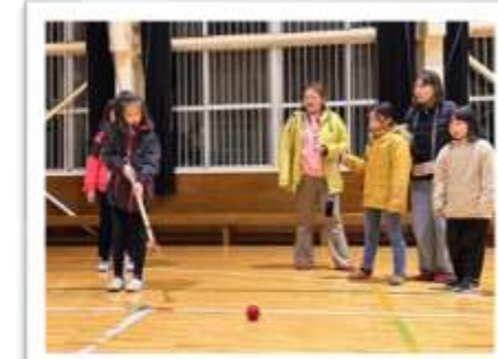
夜は室内グラウンドゴルフで交流♪