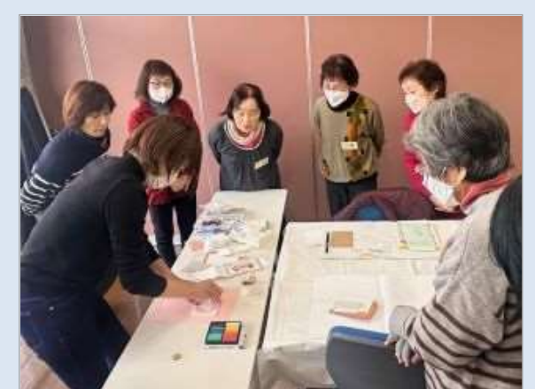
バレンタインに向けてハートが詰まった作品づくり、心温まる筆文字ハガキが完成しました♥