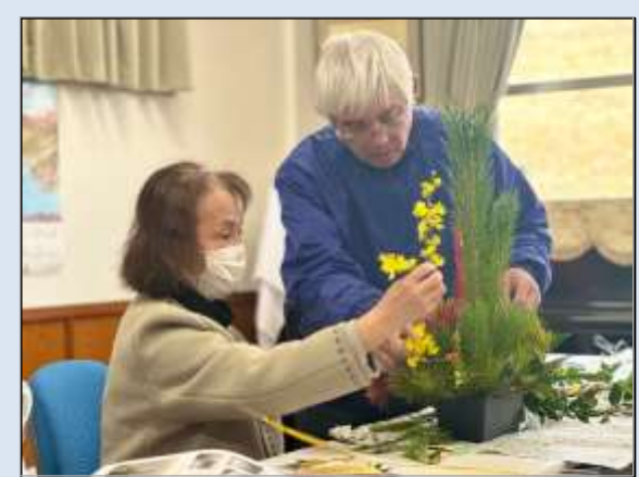
とっても豪華なお正月の花飾りが完成しました❁ 新しい1年を華やかに迎えられたでしょうか◎♥