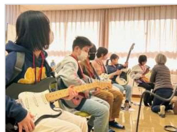
19名の受講生を迎え、めいおん講座が始動しました◎♪ 門出ライブに向けて練習を頑張ります！