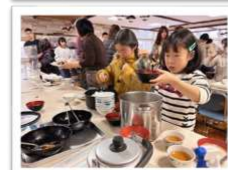
班ごとに食事の用意をしました♡