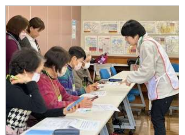
相手に通知が表示されない方法でLINEを送ることができるなど、便利な機能を学びました❁