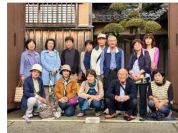
智頭の石谷家住宅に行きました。地元ガイドさんの豊富な知識に「へえ～!」の連発でした♪