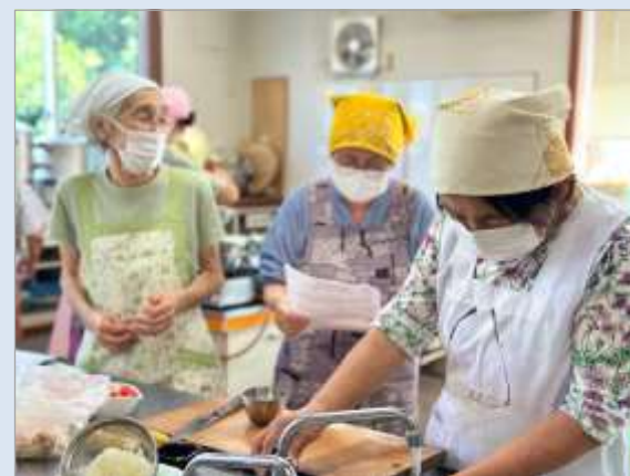
食生活改善推進員さんの楽しい講話を聞いたあと、調理・試食をして健康意識を高めました!!