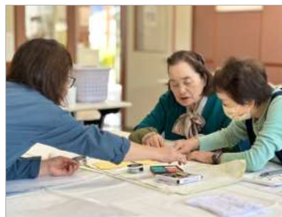
「笑」と「楽」の漢字1文字で気持ちを表現することにチャレンジし、賑やかな作品が完成しました☆