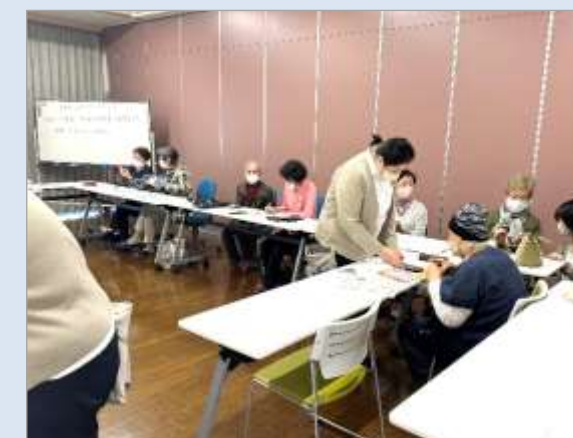
参加者多数の人気教室が最終回を迎えました。「スマホについてもっと知りたい」の声が続出です!