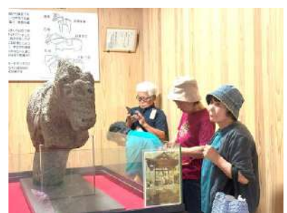
北谷コミュニティセンター

淀江町にある天神垣神社へ参拝に行き、全国で2体しか発見されていない『石馬』を特別に見せていただきました。近くの展示館でもしっかり学んだあとは大山ミルクの里でデザートタイムです。