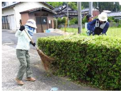
ぬのこクラブ・北谷コミュニティセンター

ぬのこクラブの方々に垣根の剪定や草取りをしていただきました。スッキリとした綺麗な環境となり皆さんに気持ちよくご利用いただけます。ご協力ありがとうございました！