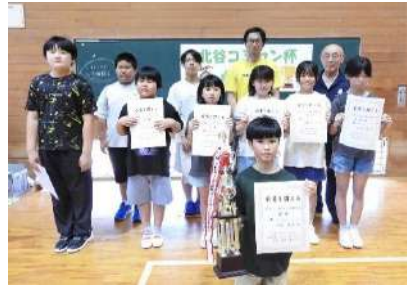
北谷コミュニティセンター

今年度は野球 3 名、卓球 10 名でスタートです。同日に卓球のコミセン杯を行い、白熱した試合が繰り広げられました。目標達成できるように、みんながケガのないように練習をがんばってください！