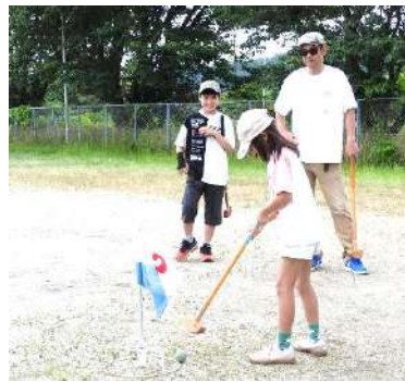
子どもいきいきプラン実行委員会・ぬのこクラブ

雨上がりの蒸し暑い朝でしたが、多くの子ども達が参加し和やかに大会が行われました。ホールインワンが出た子どももあり、あちこちで歓声が湧き上がっていました。皆が賞品をもらってニコリです。