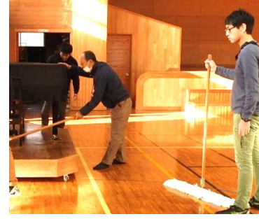
北谷小学校体育施設開放企画運営委員会

日頃利用させていただいていることへの感謝を込めて、年末の大掃除を実施しました。ピアノの下やステージまで、普段行き届かないところもピカピカに磨きました。新年もケガに気を付けつつ、楽しく運動していきます！