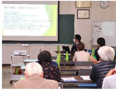
北谷地区地域安全活動推進協議会

倉吉警察署の講師さんには「思い込みで運転をしない」ことの大切さを教えていただきました。また、ATMに誘導する電話は詐欺を疑うようにとのアドバイスもありました。