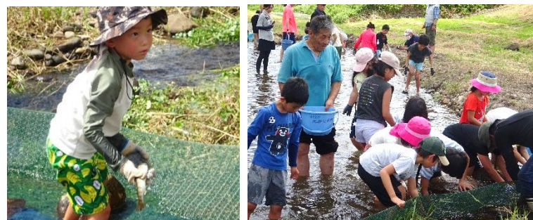
北谷地区振興協議会・子どもいきいきプラン実行委員会

大変暑い中ではありましたが4年ぶりに約170名のご参加をいただき大盛況の中、北谷川で魚のつかみ取りを開催することができました。自然と楽しむ半面、ぬのこクラブの皆さんが焼かれている川魚を横目に「早く食べたい！」と待ちきれない声が多く聞かれました♪開催にあたり河川の整備を沢谷地区の皆さんに大変お世話になりました。ありがとうございました。