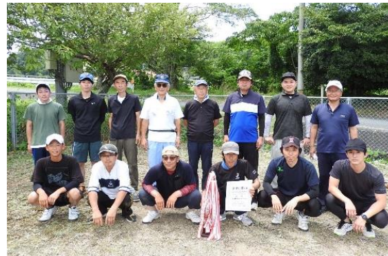
北谷地区自治公民館協議会 体育部長会