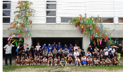
北谷コミュニティセンター

北谷小学校の皆さんをはじめ、看護大学生や地域の皆さんに協力を得て七夕飾りを完成させました。特に小学校での活動は数年に渡って行っていることもあり、6年生を中心に積極的に取り組む姿にとっても心強く頼もしかったです。