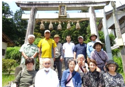
北谷コミュニティセンター

コロナで中止にしておりました神社巡りを再開しました。今回は卯年にちなみ、鳥取市の「白兔神社」をはじめ岩美町の「御湯神社」へ参拝しました。それぞれの神社で歴史や地域との関わりについて教えていただき学びを深めました。