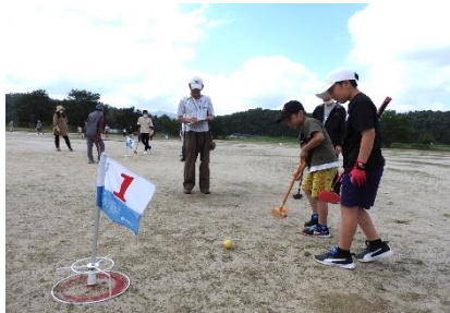
子どもいきいきプラン実行委員会・めのかクラブ

前日までの大雨を吹き飛ばして、青空のもとグラウンドゴルフ大会を開催しました。小中学生と保護者がめのかクラブの皆さんと一緒にホールをまわり、ルールや打ち方を教わりながらプレーを楽しみました。ホールインワンも出ましたよ。