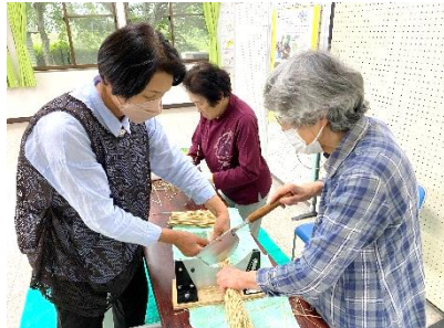
北谷コミュニティセンター

今年度最初のきみがら人形教室は、人形の製作に加え、材料になる藁の選別も皆で行いました。人形の芯となる部分なのでとても大切です。貴重な藁は地域の方にいただいたものになり大変助かりました。こういった下準備は大変ですが話しながらの作業は楽しく、とてもはかどりしました。