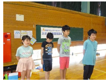
北谷コミュニティセンター

北谷地区振興協議会・青少年育成協議会・同和教育推進協議会の令和 5 年度総会にて役員及び事業内容が決定しました。三役をご紹介します。(敬称省略)