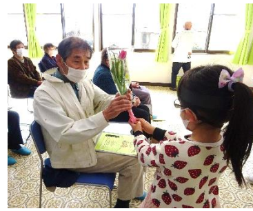
北谷地区社会福祉協議会

今年度のサロンではコロナ警報が解除されたため、念願の地域の方と北谷保育園の皆さんの交流が叶いました。ハツラツとした演技に沢山元気をもらいました。また、訪問看護や口腔ケアについても学びました。