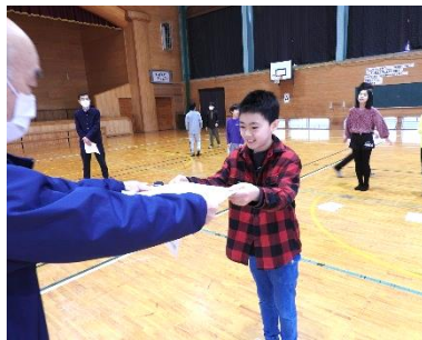
北谷コミュニティセンター

今年度は12名が卓球教室で頑張りました。この1年で下回転が出来るようになりました。ラリーが続けられるようになりましたなど、それぞれ目標が達成できたようです。新年度も楽しく頑張らしましょうね！