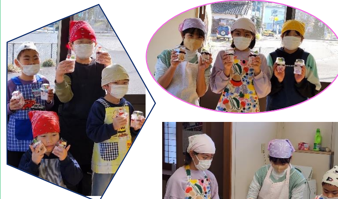
いちごのパパロアとどら焼きを作りました♪ こども7名参加