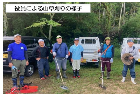
役員による山草刈りの様子