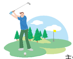
主催：上小鴨ゴルフ同好会

期日 11月19日(土) 8:15 OUTスタート (7:45集合) 場所 米子ゴルフ場 (Tel. 0859-29-4444) 料金 9,840円(食事付) 参加費(賞品代) 1,000円 競技方法 ダブルペリア 募集人数 16人 問合・申込 上小鴨コミュニティセンター (x切11/10)