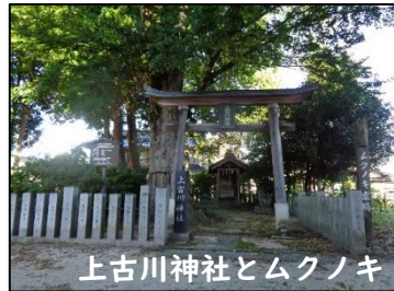
上古川神社とムクノキ