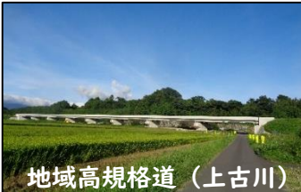
地域高規格道(上古川)