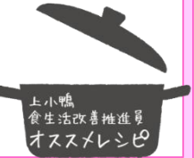
上小鴨 食生活改善推進員 オススメレシピ