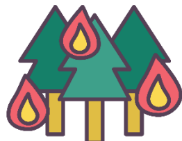
上小鴨地域づくり協議会 防災部