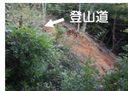
↑ あたご山登山道脇山腹崩壊

私たち自身にできるのは「自助」と「共助」です。 一人ひとりが、日頃から災害に備えてはどうでしょうか。