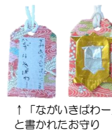
↑「ながいきばわー」と書かれたお守り