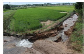
↑ 農業施設被害(若土)