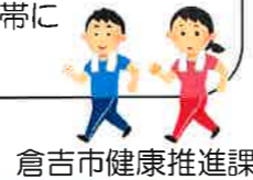
倉吉市健康推進課

歩く時間は連続じゃなくてもOK! 朝15分夕方15分と分けて歩くのと連続30分歩くのと効果は変わらないそうです。1日の時間のある時にムリなく好きな時間帯にウォーキングしてみましょう♪