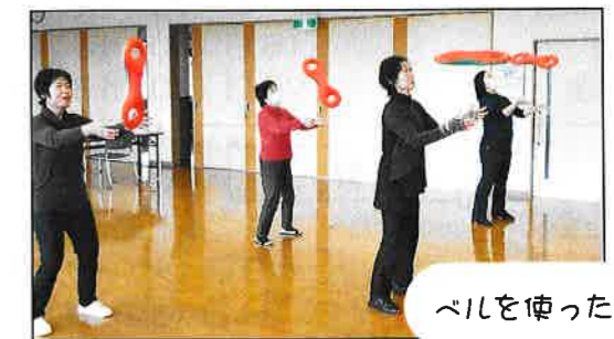
ベルを使った体操