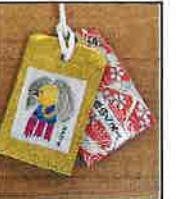
アマビエ様のお守り☆