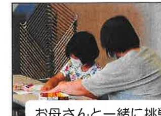
お母さんと一緒に挑戦！