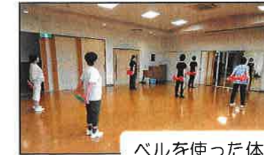
ベルを使った体操