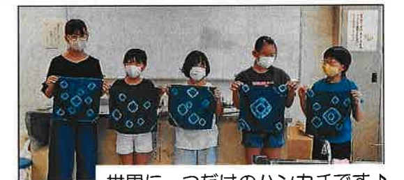
世界に一つだけのハンカチです♪

中部ものづくり道場の方にサポートいただきながら、子ども達は綿の布にビー玉や割りばしを使い、模様作りを行いそれぞれ素敵な作品が出来上がりました。