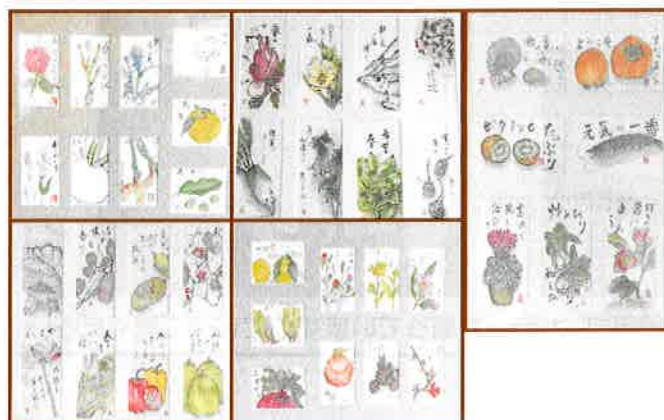
ちょこっとギャラリー 4月展示 絵手紙サークルさんの作品

国の緊急事態宣言を受けまして、公民館の貸館が5月6日(水)まで中止となっております。中止期間が延長の場合がございますので、詳細は公民館または代表者の方までお問合せください。