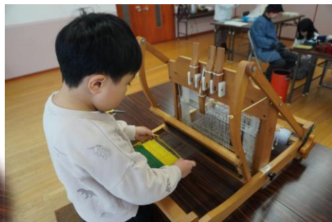
はじめてのはたおり頑張ってます