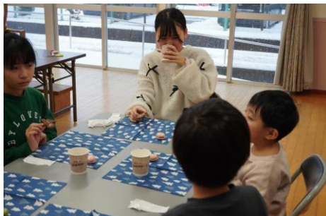
ハナちゃん先生の手づくりおやつでティータイム♪