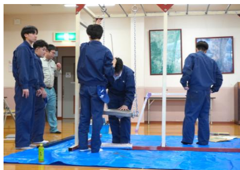
組み立てをしています

「見たことがない遊具を作りたい」と、一から考え手作りされた遊具を高校生に見守られながらたくさん楽しみました。