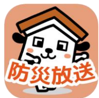
アプリのアイコン