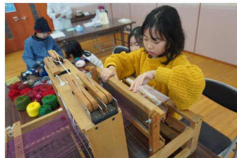
4年目・・・余裕の手さばきです