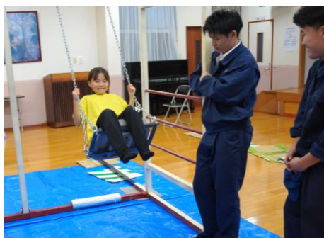
高校生に見守られるリーダーさんたち