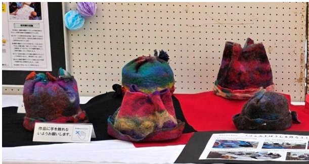
夏休み手仕事教室：フェルトぼうしを作ろう！