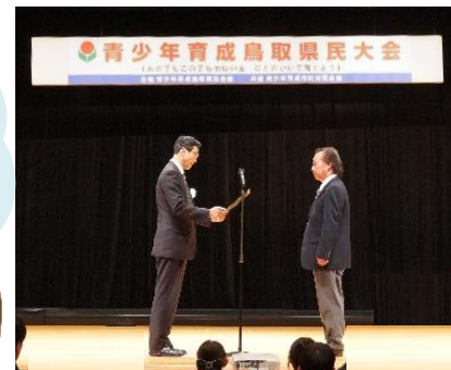
11/9 三朝町総合文化ホールにて