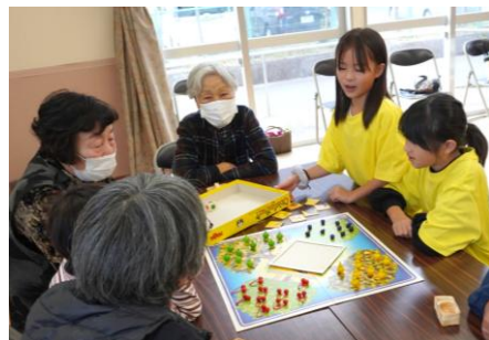
11/21高齢者いきいき交流会