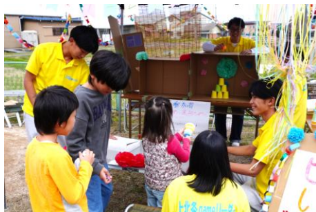
11/2上北条まつり屋台「ピンポン卓球」

高齢者いきいき交流会では、上北条地区社会福祉協議会から依頼を受け、スタッフとして参加者の皆さんに喜んでもらいました。