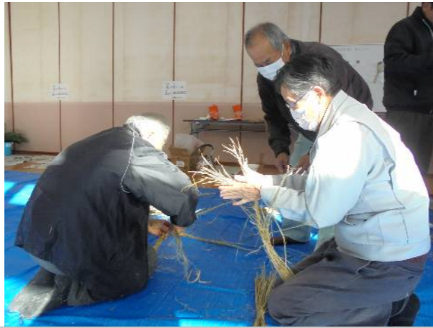
12/22 (金) しめ縄づくり教室 指導/くらぶ悠・遊・友