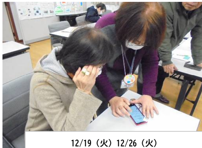
12/19 (火) 12/26 (火) ～安全に使うための～スマホ教室