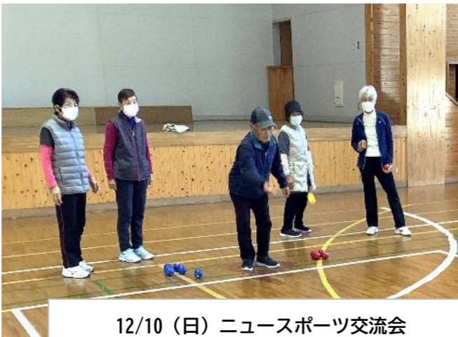
12/10 (日) ニュースポーツ交流会 まちづくり協議会社会教育部-スポーツ推進委員-