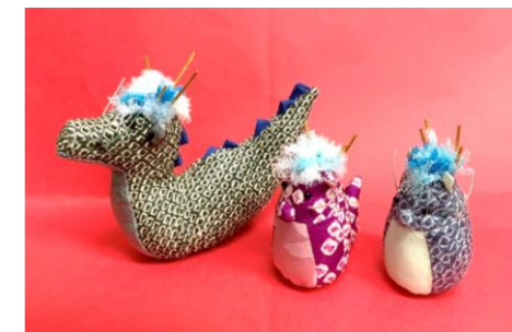
手芸教室さんの作品