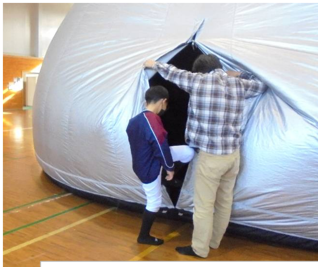
12/9 (土) 移動式プラネタリウム上映会 子どもいきいきプラン事業共催