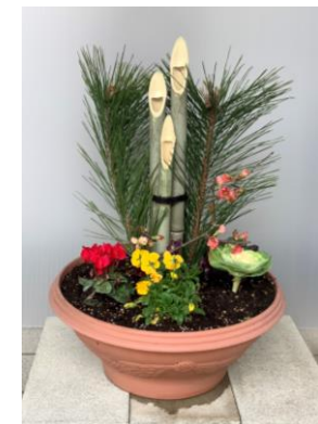
門松/西谷正敏さん作