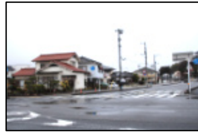
区画整理で拡がった道。写真左は旭北の住宅群。(駅北側)