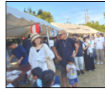
(右)超人気の焼きそば。(下)キッズ記念品プレゼントコーナー

後6時頃には、約300名を超える人出となりました。若い家族づれが目立ち、以前とはひと味違った雰囲気、予想をはるかに超える賑わいとなりました。(戸)