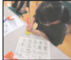
心こめたメッセージを書

りました。笑顔で感謝の気持ちを伝えることが出来てよかったです。昼食はとてもおいしく、作って下さった方の思いがこめられていてさらに美味しかったです。