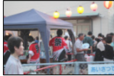
バルーンアートで遊ぶ(右)・賑わいの飲食コーナー

海田西町河北町 7/29(土) 18:30～公民館と周辺で開かれました。受付で、加入者世帯に「お祭りチケット」が渡されました。久しぶりに会う人、毎日会う人…。挨拶・会話。飲食コーナー辺りは、笑顔があふれる暖かい交流の場になり、「地域の繋がりが」感じられるイベントになりました。(杉)