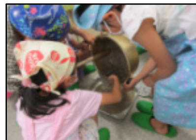
バットに移し、完成間近！

「炭酸Naを入れてかき混ぜると、だんだん重たくなるのが楽しかった」 「醤油をつけて食べるとすごく美味しかった」