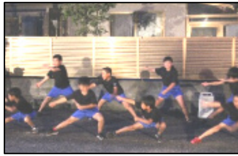
小学生の「ソーラン節踊り」。声あわせて踊る。躍動感・リズム感いっぱい。

海田西町河北町 7/29(土) 18:30～公民館と周辺で開かれました。受付で、加入者世帯に「お祭りチケット」が渡されました。久しぶりに会う人、毎日会う人…。挨拶・会話。飲食コーナー辺りは、笑顔があふれる暖かい交流の場になり、「地域の繋がりが」感じられるイベントになりました。(杉)