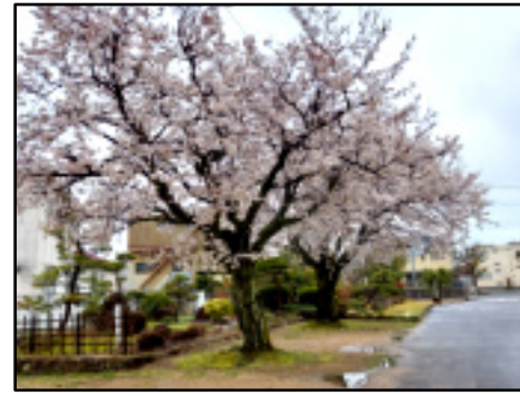
平年より、1週間は早い開花 (3/24鳥取県立人材育成センターで。)