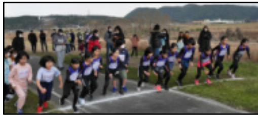
小学生の「マラソン」のスタート