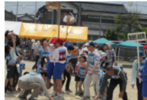
運動会の花！「玉入れ」の熱戦

とき 5月14日(日)9時開会 ところ 河北小学校グラウンド ※「地区敬老会」は、6月実施の予定で検討されています。