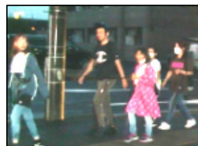
和やかにウォーク

「雨が降っていて最初は嫌だったけど、友達と一緒に最後まで歩くことが出来て楽しかったです」 「雨の中、歩いて疲れたけど、ゴールした時はとても気持ち良かったです」