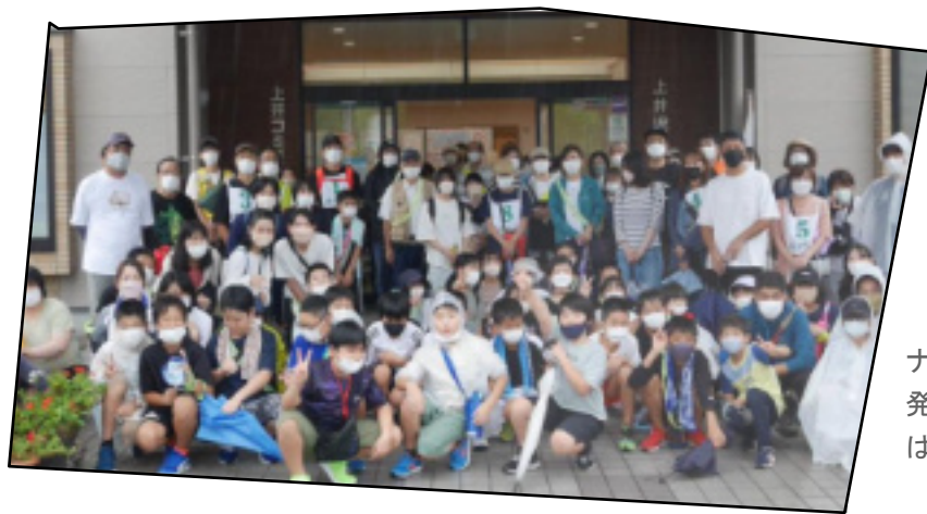
ナイトハイイク発です。元気いっぱいの参加者。