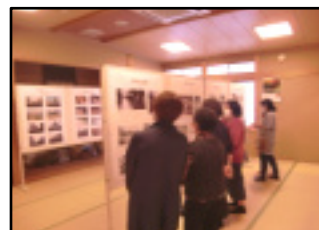
「昭和の上井」記念写真特別展示光景（昨年）