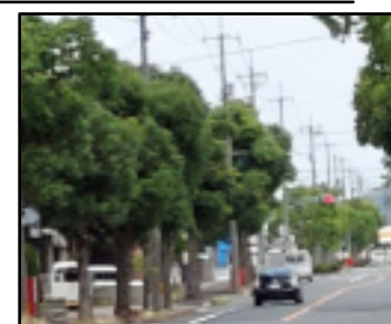
▲歩道に「ホース格納箱」を見かけた。(清谷地区)