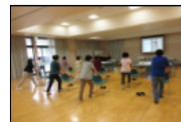
フレイル予防の体操

【参加者の声】 「フレイルの恐れがあると結果が出て驚きましたが、がんばって予防に取り組んでいきたいです」「フレイルではありませんでしたが、これからも気を付けていきたいです」