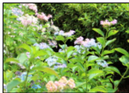
静岡の友から送られた3年目の紫陽花。大切な、元気を貰う花です。(7月10日。我が家の庭で...S)

ガソリン高騰。円安(1ドル=139.5円:7/21)。何と、ガソリンは1ℓ168円。おまけにコロナ感染者は昨日過去最多の573人。よけいに暑さつる夏です。(7/22 記)