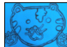
受賞作品の下絵と受賞作品