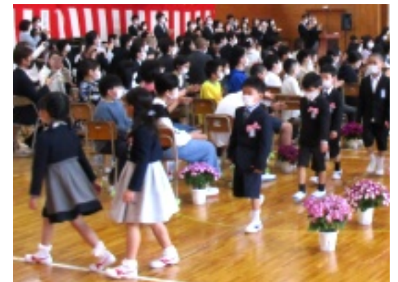
教室に向かう1年生