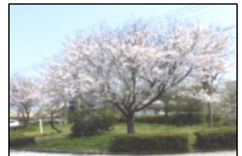
新入生を迎えた河北 小学校の桜