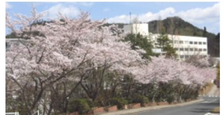
鳥取看護大学を望む。 華麗な桜