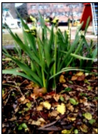
寒空咲く水仙(上井一丁目児童公園で)

「ラニーニャ現象」で、厳冬になるかも知れません」という予報でしたが、何度も雪が降ります。年末から、雪の姿は消えません。2月も中旬だというのに、また、雪。17日は積雪28センチ。そんな2月の点描です。