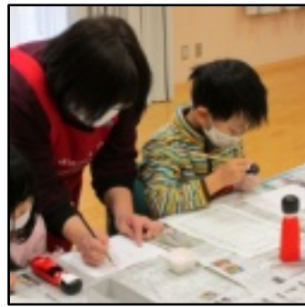
細い筆でチャレンジ

11月27日、倉吉に江戸時代から伝わるはこた人形の「絵付け・顔かき」体験教室が開かれました。12名の参加者は悪戦苦闘しながらも、世界に一つだけの「はこた人形」を完成させました。(写真＝左)