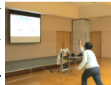
画面を見ながらのボウリング。

11月16日(木)、上井コミュニティセンターで「e-スポーツ体験会」が開催され、コンピューターゲームでボウリングを楽しみました。初めてでも、操作に慣れるとストライクが出るよう