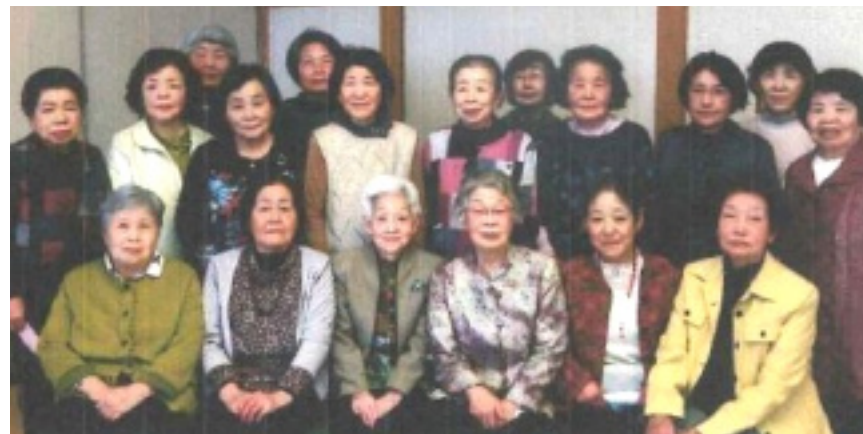
3月、水明荘での研修会で。

料理教室・研修旅行・健康教室・上井地区の老人会・ミニ運動会参加予定です。色々な人と出会い、知り合いもでき、明るく、楽しくやっています」 「新会員の加入が少ないので、募集中です！皆さん、一緒にやりませんか？」 (取材・まとめ 杉本)