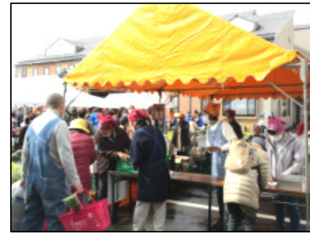
賑わい! 「青空市場」コーナー(上) 「こども福引き」コーナー(下)