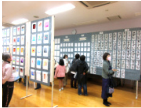
(上) 小・中学生の作品が沢山展示されています。(下) コミセン2階から。演奏の様子。

10月28日(土)~11月3日(金)の7日間、「あげい祭」が開催されました。特に印象的だったのは、河北中学生在ボランティア活動して「まつり」の裏方として協力するすがたでし